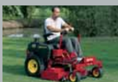
SRZ Benzyna/Diesel 15–27 km