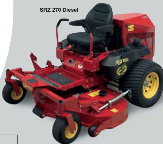
SRZ 270 Diesel

➤ SRZ 270 Diesel "Topowy" model serii SRZ. Główną zaletą tej kosiarki jest przednia oś i system płynnej regulacji poziomu nachylenia agregatu. System ten pozwala na płynne dostosowywanie się agregatu do pochyłości terenu i daje wysoką jakość cięcia oraz zapobiega zerwaniu darni. SRZ 270 daje większą płynność jazdy, komfort i bezpieczeństwo. Dźwęż sterowniczy wysokości cięcia agregatu zwiększa wytrzymałość i niezawodność agregatu tnącego. Komfortowe siedzenie z wysokim tylnym oparciem i regulowanym zawieszeniem daje operatorowi bardzo dużą wygodę pracy.