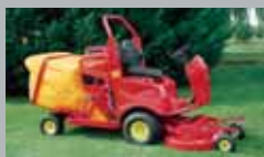
TG 200 Benzyna/Diesel 20 km