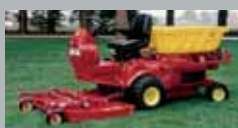
SR Benzyna/Diesel 20–27 km