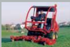
Turbo 5 Diesel 50 km