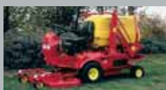
PG Benzyna/Diesel 20–27 km