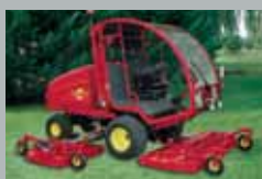
Turbo 6 Diesel 60 km