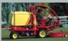
Turbo 1-1W-2-4 Diesel 26–36 km