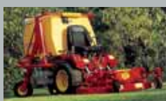
Turbograss Benzyna/Diesel 18–22 km